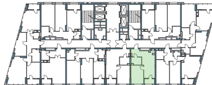
РОЗМІЩЕННЯ КВАРТИРИ НА ПОВЕРСІ