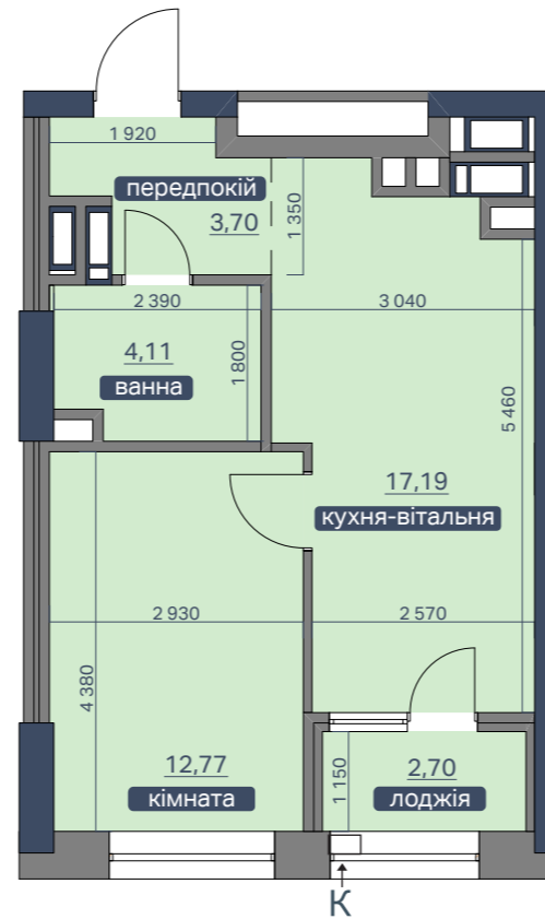
ПЛАН КВАРТИРИ З ОСНОВНИМИ РОЗМІРАМИ

* подана інформація та вказані площі мають виключно попередній, ознайомлювальний характер, та можуть бути змінені; К – місце розміщення зовнішнього блоку кондиціонера;