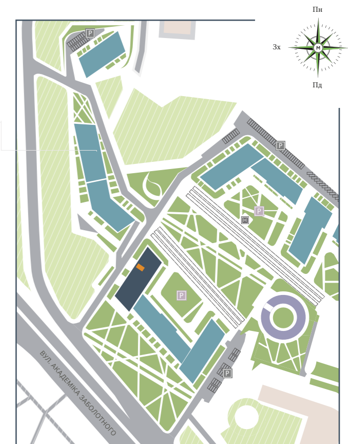
БУДИНОК НА ГЕНЕРАЛЬНОМУ ПЛАНІ