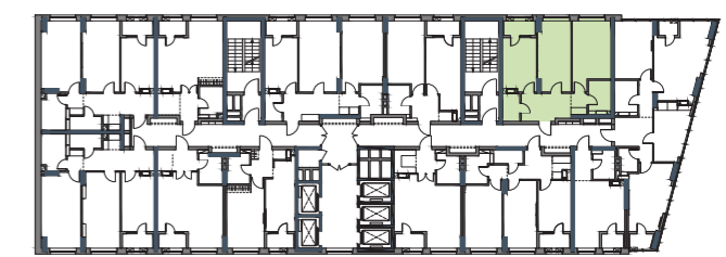
РОЗМІЩЕННЯ КВАРТИРИ НА ПОВЕРСІ

подана інформація та вказані площі мають виключно попередній, ознайомлювальний характер, та можуть бути змінені; К – місце розміщення зовнішнього блоку кондиціонера; висота приміщення – 2,7 м.