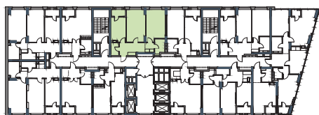
РОЗМІЩЕННЯ КВАРТИРИ НА ПОВЕРСІ

К – місце розміщення зовнішнього блоку кондиціонера; висота приміщення – 2,7 м.