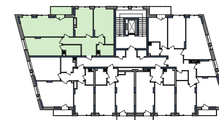
РОЗМІЩЕННЯ КВАРТИРИ НА ПОВЕРСІ

подана інформація та вказані площі мають виключно попередній, ознайомлювальний характер, та можуть бути змінені; К – місце розміщення зовнішнього блоку кондиціонера; висота приміщення – 2,7 м.