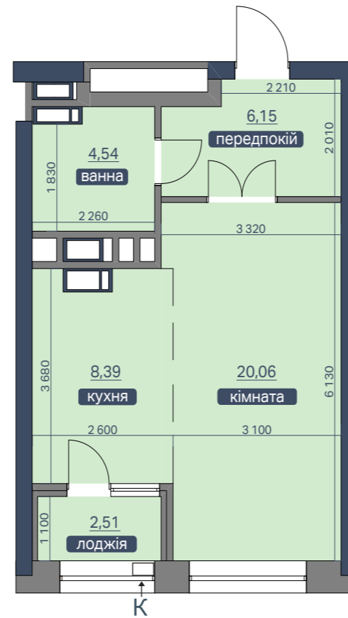
ПЛАН КВАРТИРИ З ОСНОВНИМИ РОЗМІРАМИ