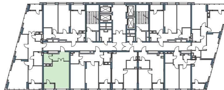
РОЗМІЩЕННЯ КВАРТИРИ НА ПОВЕРСІ