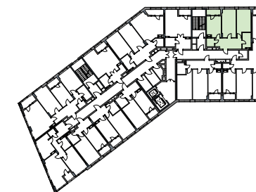
РОЗМІЩЕННЯ КВАРТИРИ НА ПОВЕРСІ

подана інформація та вказані площі мають виключно попередній, ознайомлювальний характер, та можуть бути змінені; К – місце розміщення зовнішнього блоку кондиціонера; висота приміщення – 2,7 м.