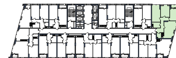
РОЗМІЩЕННЯ КВАРТИРИ НА ПОВЕРСІ

подана інформація та вказані площі мають виключно попередній, ознайомлювальний характер, та можуть бути змінені;