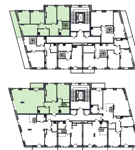
РОЗМІЩЕННЯ КВАРТИРИ НА ПОВЕРСІ

подана інформація та вказані площі мають виключно попередній, ознайомлювальний характер, та можуть бути змінені; К – місце розміщення зовнішнього блоку кондиціонера;