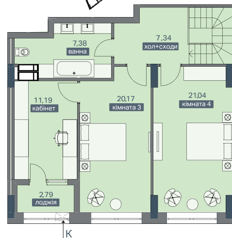
ПЛАН КВАРТИРИ - 10 ПОВЕРХ