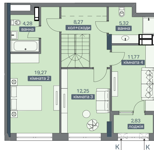
ПЛАН КВАРТИРИ - 10 ПОВЕРХ